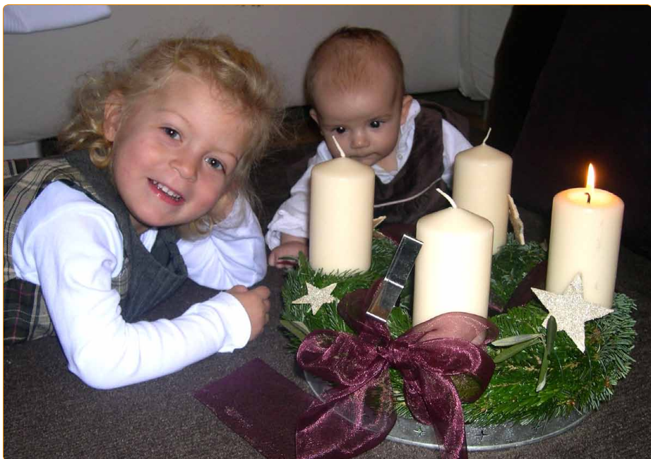
Kinder der Familie Schreiner beim Adventkranz

Statement der Familie Schreiner, die religiöse Elternbildungsangebote gerne wahrnimmt