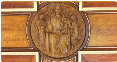
Fotografie der Raumdecke des Florian-Zimmer-Saales, Pastorale Dienste

In vielen Pfarren werden traditionell am letzten Sonntag im Kirchenjahr auch Jugendgottesdienste gefeiert. Die Feier des Christkönigsonntags kann ein Anlass sein, wieder einen neuen Akzent zu setzen, indem persönlich junge Menschen zur Eucharistiefeier eingeladen oder z.B. die Fürbitten für und mit jungen Menschen gesprochen werden. Die Kath. Jungschar hat gemeinsam mit der Kath. Jugend unter dem Titel „Amen und noch mehr“ Anregungen zur Gestaltung eines Gottesdienstes zusammengestellt. Dies wird den Pfarren noch zugesandt und ist in Kürze auch auf http://stpoelten.kjweb.at/ als Download zur Verfügung gestellt.