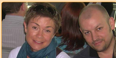
Familie Schreiner Pfarre Korneuburg (seit Kurzem umgezogen)