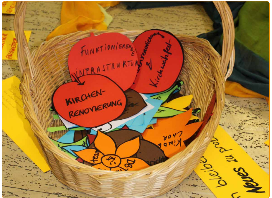
Die Früchte der Zusammenarbeit im PGR werden dankbar in den Erntekorb gelegt.

Für eine intensivere Standortbestimmung empfiehlt sich eine halbo- oder eintägige Bilanzklausur , die das