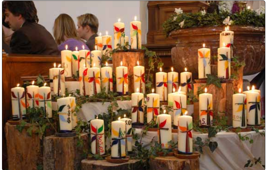
Firmvorbereitung: Firmkerze und Firmtagebuch in der Pfarre Gföhl.

Bei einer Begegnung mit Firmlingen wurde mir die Frage gestellt: „Was ist als Abt ihre liebste Tätigkeit?“ Spontan antwortete ich: „Firmen“ – „das Sakrament der Firmung spenden.“ In den fünfundzwanzig Jahren meines äbtlichen Dienstes durfte ich beinahe 20.000 junge Menschen im Sakrament der Firmung mit der Gabe des heiligen Geistes bestärken und so ihr Christ-Sein, ihr Getauft-Sein, ihr Mitglied-der-Kirche-Sein besiegeln. Ich tue diesen Dienst gern, freilich – wie ein Sämann – „auf Hoffnung hin“. Jedem der Gefirmten möchte ich mit dem heiligen Paulus sagen: „Meine Hoffnung für dich ist unerschütterlich! (vgl. 2Kor 1,13). Du bist Gottes geliebtes Kind/Sohn/Tochter. Gott legt seine Hand auf dich. Dein Name ist in seine Hand geschrieben. Darum habe keine Angst! Hab Vertrauen! Gott ist bei dir. Du bist von Gott begnadet, gesegnet, gesalbt und gesendet. Du wirst ein Segen sein! (vgl. Gen 1,12). Gott hat Großes mit dir vor! Gott braucht dich! Ohne dich wäre die Welt ein Stück leer von Christus.“ Freilich sollte den jungen, gefirmten und damit kirchlich volljährigen Christen auch von der Kirche bzw. den Pfarrgemeinden deutlich und einladend vermittelt werden: Wir freuen uns über euch! Wir brauchen euch! Ihr seid eingeladen, mitzuarbeiten, eure Talente einzusetzen! Auf euch kommt es an! Ihr seid Kirche – die Kirche der Zukunft!