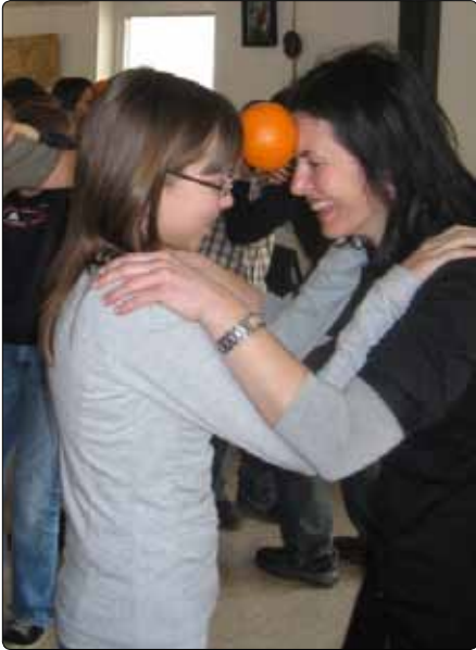
Beim gemeinsamen Nachmittag lernen sich Firmlinge und Paten auf verschiedenen Ebenen besser kennen.

„Such jemand, der mit dir auf die Reise geht“ (Tob 5,3) – praktische Überlegungen zur Arbeit mit Paten und Patinnen