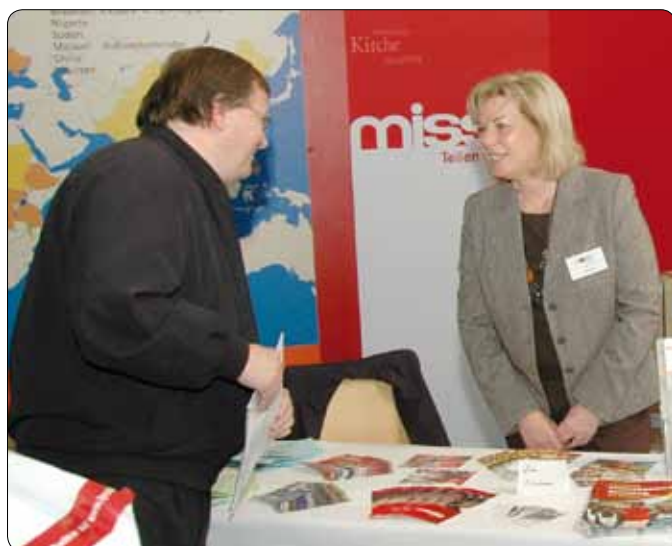
Neben Firmen präsentieren auch viel kirchliche Einrichtungen ihre Dienstleistungen auf der Gloria-Messe in St. Pölten.

Messefolder liegen in den Kirchen auf. Den Pfarrgemeinderäten wurden die Tickets bereits im Mai zugesandt. Insgesamt lohnt es sich für alle kirchlich interessierten Menschen dabei zu sein.