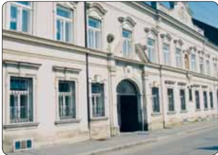
Klostergasse 15 wird generalsaniert

Was viele Haupt- und Ehrenamtliche im kirchlichen Bereich nicht mehr zu hoffen wagten, wird jetzt in Angriff genommen: Die Generalsanierung und Renovierung des Hauses Klostergasse 15-17, Hauptquartier des bisherigen Pastoralamtes und der Kath. Aktion – jetzt: Pastorale Dienste .