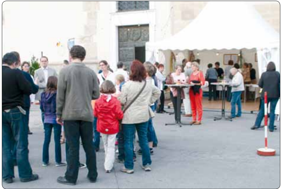
Viele Ehrenamtliche helfen unentgeltlich mit, damit kirchliche Veranstaltungen auch gelingen und als „unvergessliches Event“ erlebt werden können. (Bild: Lange Nacht der Kirchen 2009, Dompfarre St. Pölten)

Ehrenamtlich tätig zu sein, das heißt nicht, mich aufzuopfern für andere, mein Selbst aufzugeben. Es bedeutet vielmehr, dass kirchliche Einrichtungen und Organisationen Rahmenbedingungen schaffen müssen für eine gelingende Mitarbeit, für eine Kultur des Ehrenamts. Es geht darum, das „Haus Kirche“ so zu gestalten, dass es Raum für alle bereits aktiven Ehrenamtlichen und Hauptamtlichen bietet, dass dieser Raum optimiert wird und für viele Menschen einladend gestaltet ist.