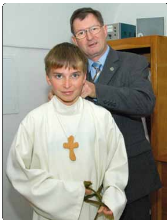
MinistrantenbegleiterInnen organisieren oft nicht nur den Altardienst der MinistrantInnen, sondern leisten auch Mesnerdienste.