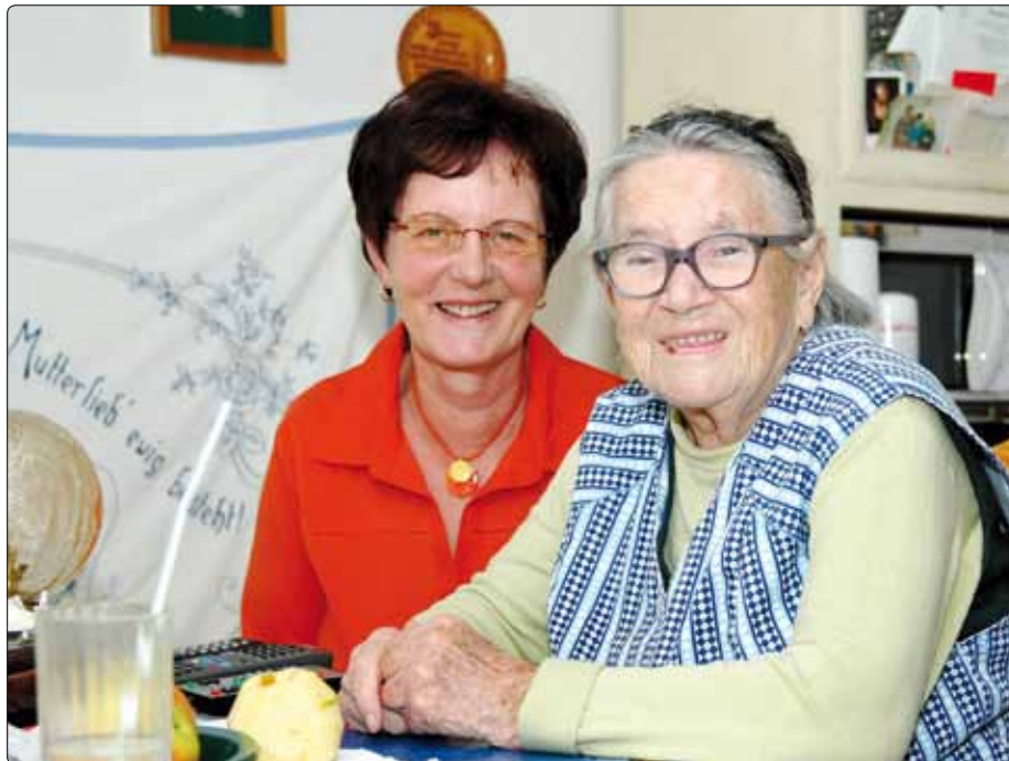
Ehrenamtliche schenken Mitmenschen regelmäßig Zeit. Viele Pfarren und kirchliche Einrichtungen (im Bild Pfarre und Caritas Sozialstation Wieselburg) organisieren seit vielen Jahren Besuchsdienste. (Besuchsdienstseminare, siehe Seite 7)

Ein anderer Aspekt in Bezug auf das Bild vom Leib ist ebenso wichtig: Der Leib „funktioniert“ auch nur deshalb, weil nicht alle seine Glieder immer und zu jeder Zeit vollkommen aktiv sein müssen. Ruhephasen sind genauso wichtig. Versuchen wir einmal in einer Pfarre nicht nur die großen „Organe“ wahrzunehmen, die sehr aktiven, sondern alle die dazugehören. Dabei werden wir vieles entdecken, letztendlich aber die Menschen mit ihrer Freude und Hoffnung, ihrer Trauer und ihrer Angst. Und daraus ergibt sich eine Menge Möglichkeit einander Gutes zu tun!